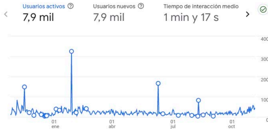
Usuarios activos por País